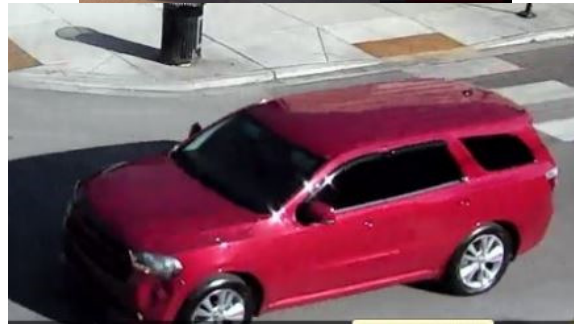
Foto real del conductor y el vehículo